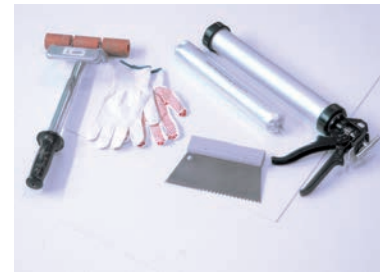
Zubehör - Direktverklebung