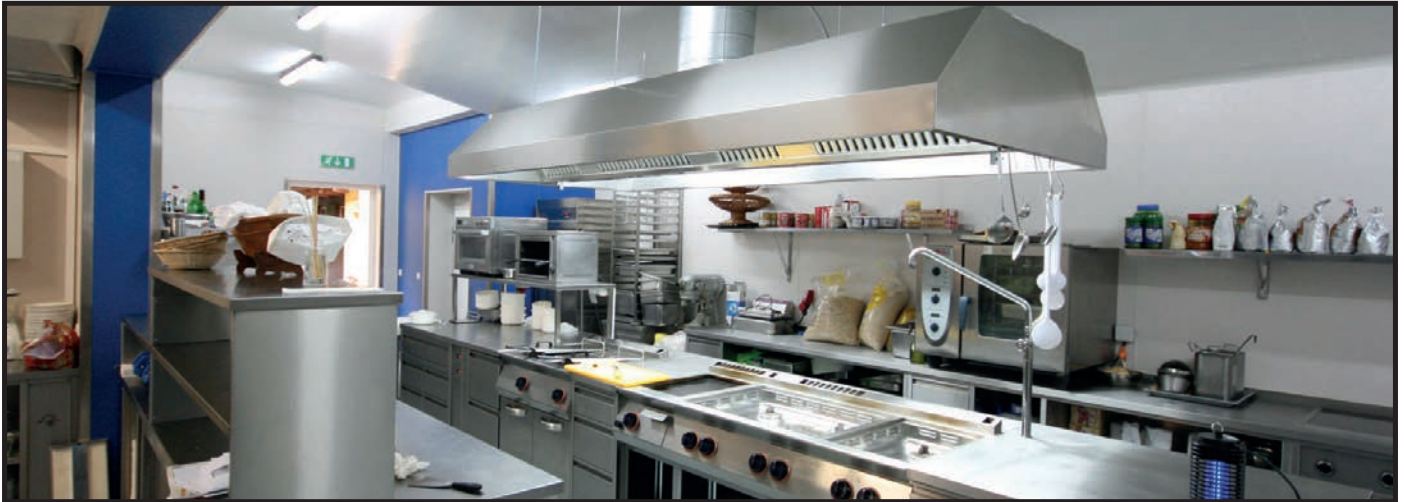
Installationen im Küchenbereich