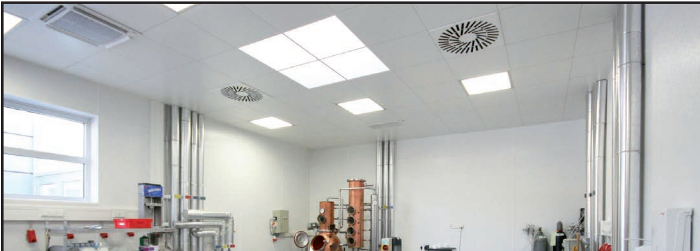
Einsatzbereich - Labor